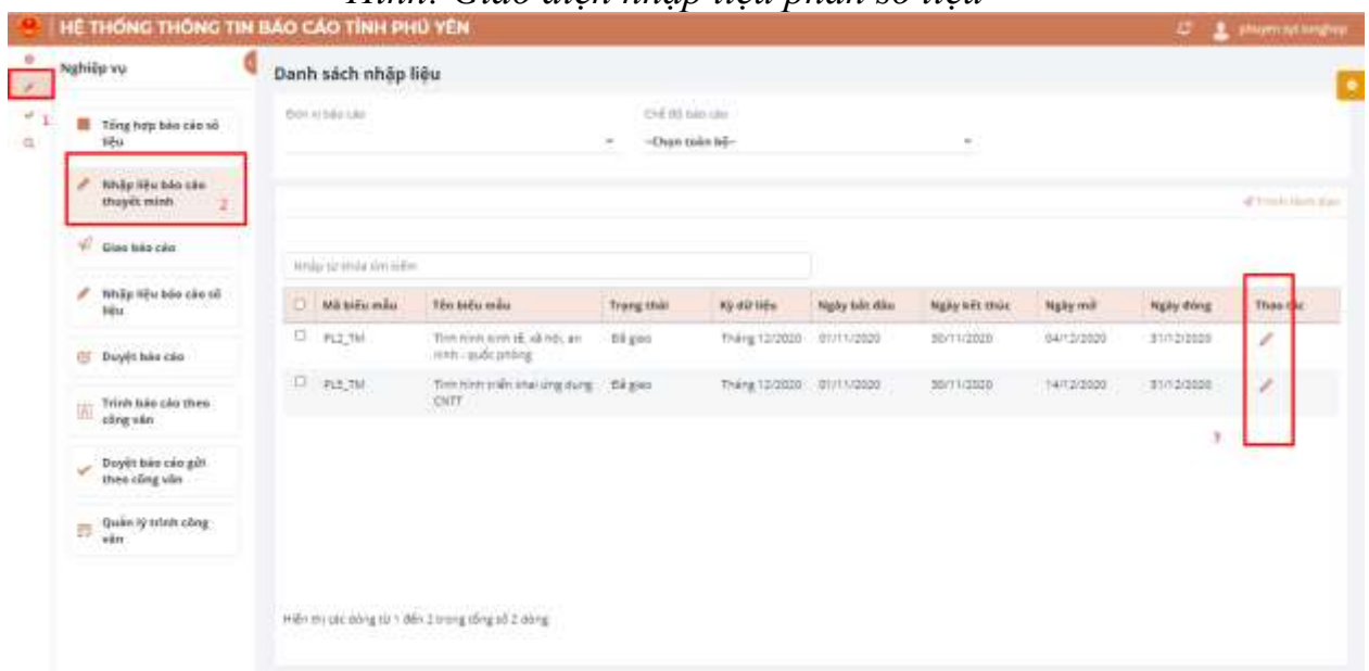
Hình: Giao diện nhập liệu báo cáo thuyết minh

Bước 2: Chuyên viên tổng hợp trình báo cáo lên lãnh đạo xem xét